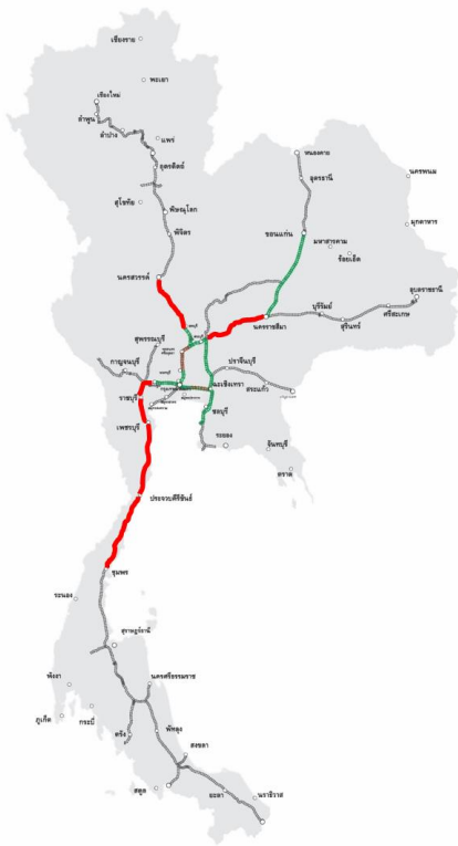
โครงการก่อสร้างรถไฟทางคู่ ระยะที่ 1 จำนวน 5 โครงการ